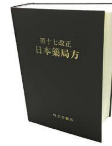
図1. 第十七改正 日本薬局方