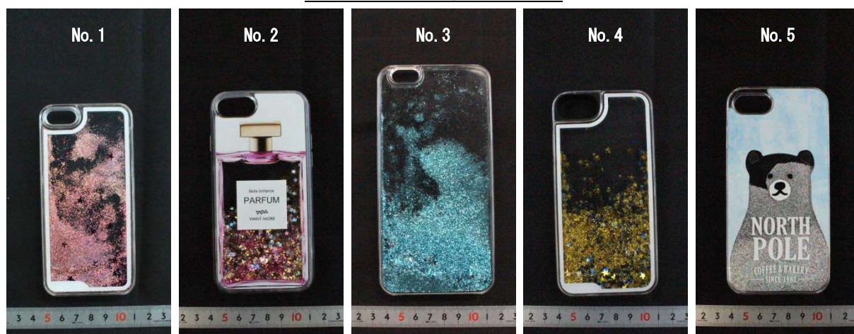
写真. テスト対象銘柄の外観